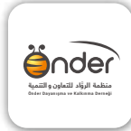
ÖNDER Dayanışma ve Kalkınma Derneği