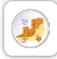
Kurtarılmış Bölgelerdeki Halep Üniversitesi